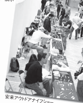
安来アウトドアナイフショー