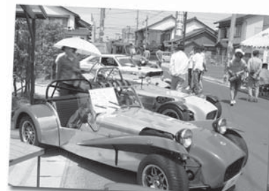
クラシックカー展示